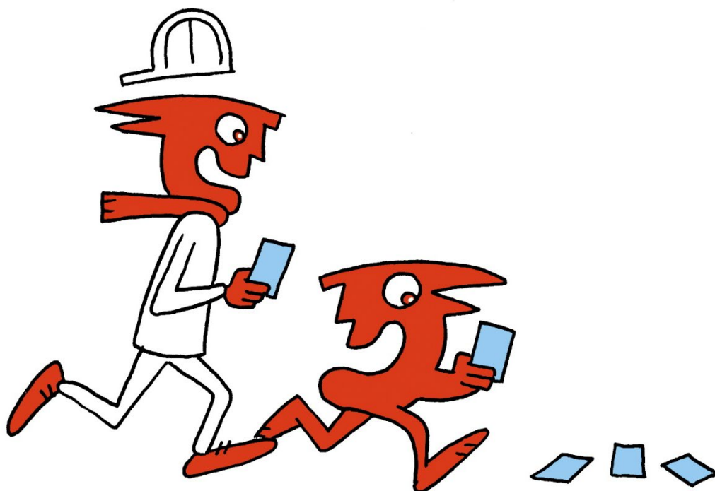
Illustration af www.saxoart.dk