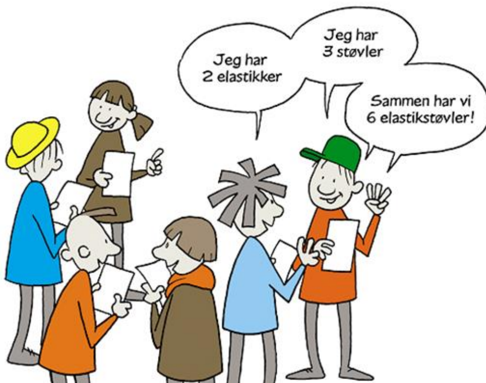
Illustration af www.saxoart.dk

Aktiviteten er en del af mit bidrag til +Maker fra M+ i Norge – et netbaseret norsk matematiksystem, som inspirerer lærere til varieret undervisning.