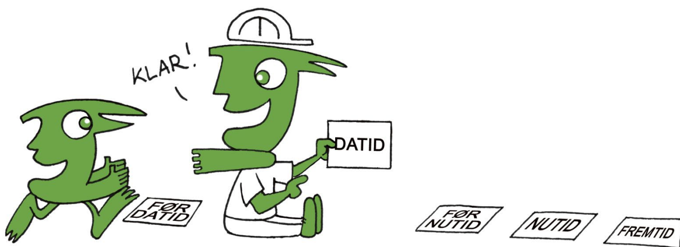
Illustration af www.saxoart.dk