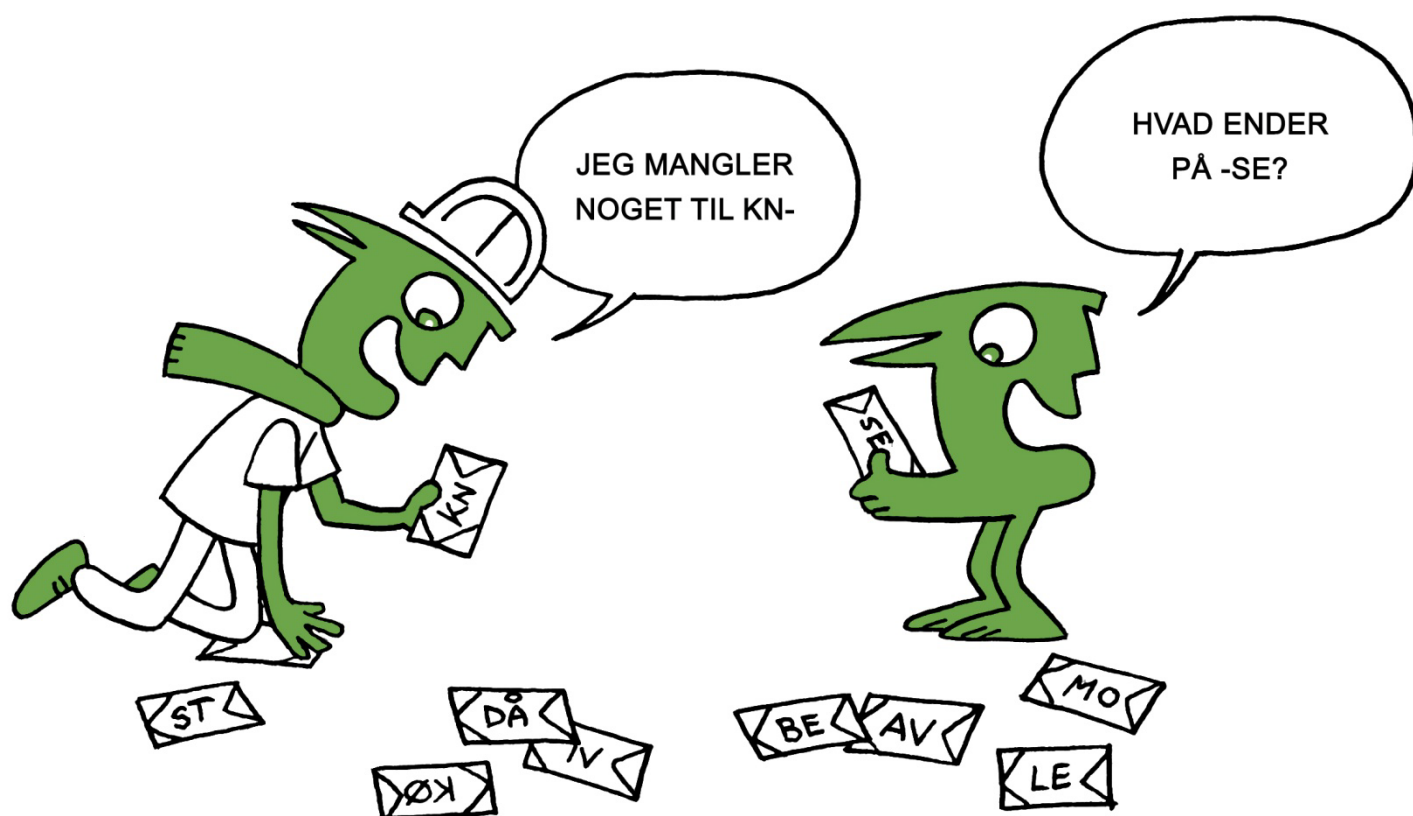
Illustration af www.saxoart.dk