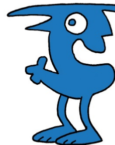
Illustration af www.saxoart.dk