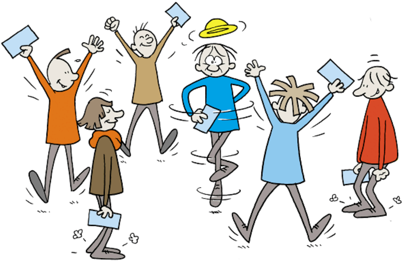
Illustration af www.saxoart.dk

Aktiviteten er en del af mit bidrag til +Maker fra M+ i Norge – et netbaseret norsk matematiksystem, som inspirerer lærere til varieret undervisning.